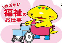
岐阜県「社協マスコット キャラクター」ともにん

TEL 058-278-1823 / FAX 058-276-2571 / E-mail kenshu-center@winc.or.jp