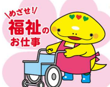
岐阜県「社協」マスコットキャラクター「とも」

TEL 058-278-1823 / FAX 058-276-2571 / Email kenshu-center@winc.or.jp