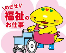
岐阜県「社協マスコットキャラクター」ともにん

TEL 058-278-1823 / FAX 058-276-2571 / Email kenshu-center@winc.or.jp