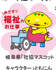
岐阜県「社協マスコット キャラクター」ともにん

TEL 058-278-1823 / FAX 058-276-2571 / E-mail kenshu-center@winc.or.jp