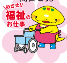
岐阜県「社協マスコットキャラクター」ともにん

14 申込み先 社会福祉法人 岐阜県社会福祉協議会 岐阜県福祉人材総合支援センター 問合せ先 (担当: 広瀬・高橋) 〒500-8385 岐阜市下奈良2-2-1 岐阜県福祉・農業会館内 TEL 058-278-1823 / FAX 058-276-2571 / Email kenshu-center@winc.or.jp