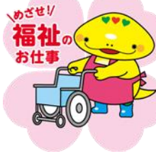
岐阜県「社協マスコットキャラクター」ともにん

〒500-8385 岐阜市下奈良2-2-1 岐阜県福祉・農業会館内 TEL 058-278-1823 / FAX 058-276-2571 / Email kenshu-center@winc.or.jp