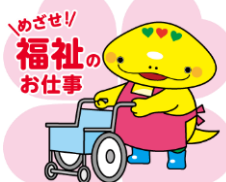
岐阜県「社協」マスコットキャラクター」とともに