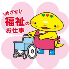
岐阜県「社協マスコット キャラクター」ともにん

TEL 058-278-1823 / FAX 058-276-2571 / Email kenshu-center@winc.or.jp