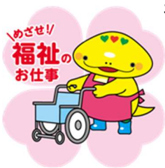
岐阜県「社協マスコットキャラクター」ともにん

〒500-8385 岐阜市下奈良2-2-1 岐阜県福祉・農業会館内 TEL 058-278-1823 / FAX 058-276-2571 / Email kenshu-center@winc.or.jp