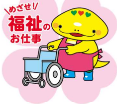
岐阜県「社協マスコット キャラクター」ともいん

TEL 058-278-1823 / FAX 058-276-2571 / Email kenshu-center@winc.or.jp