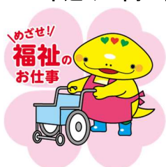
岐阜県「社協マスコット キャラクター」ともにん